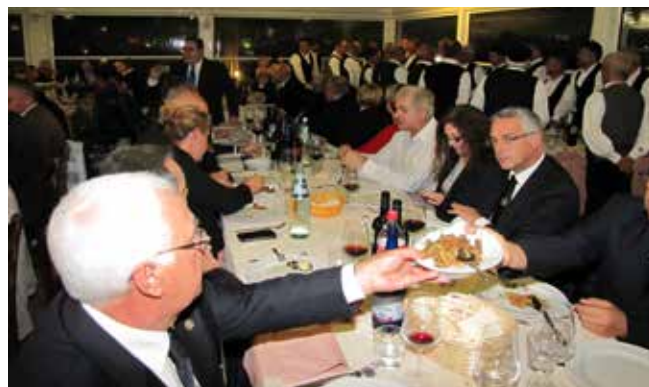
Večer se je nadaljeval pozno v noč

Po zajtrku v hotelski restavraciji smo odšli pred ho-