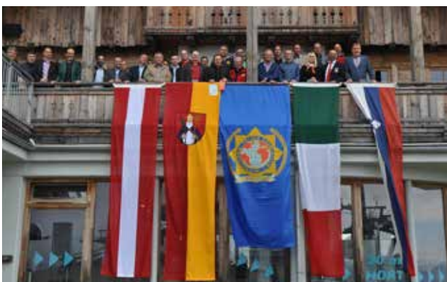
Skupinski posnetek udeležencev

V letu 2017 bo IPA RK Gorenjske organizator srečanja županov, vodstvenih delavcev Policije in IPE.