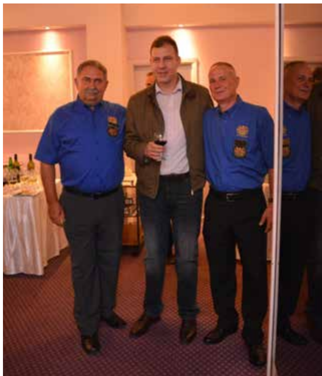
V družbi s predsednikom IPA sekcije Makedonije na sprejemu

Naslednji dan se je ob 9.00 uri pričel uradni del konference, ki je bil v zgradbi Porta Makedonije, ki simbolizira makedonsko neodvisnost. V njej so konferenčne dvorane. Namenjena pa je tudi sklepan-