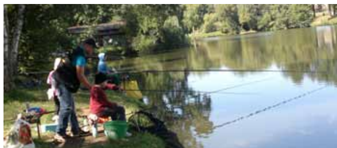
Utrinek iz ribolova