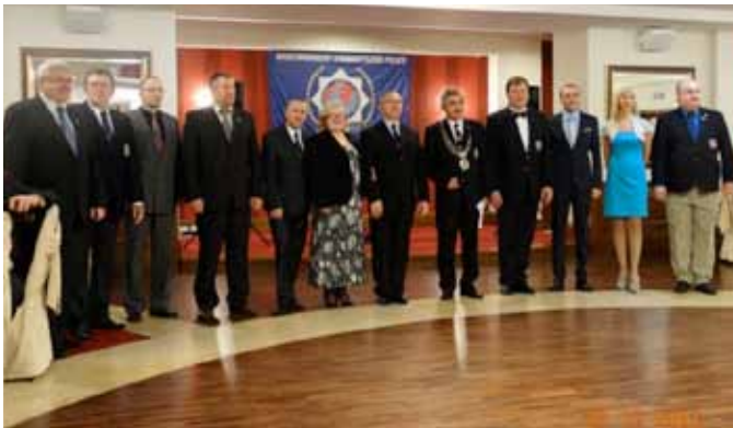
Slovesni otvoritvi kongresa so prisostvovali gostje 16 držav.