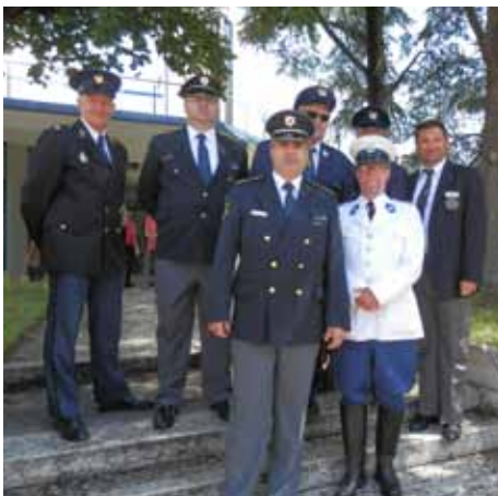
Predstavniki Slovenije, Italije, Finske in Nizozemske

V soboto, 13. junija, je ob 17.00 sledila zaključna predstavitev vseh držav udeleženk ter podelitev spominskih plaket. Tedensko druženje je s čudovito izvedeno glasbo s koncertom zaključil orkester italijanske policije. Sledila je skupna večerja in nepozabno druženje do jutranjih ur.