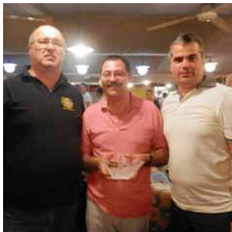
Izmenjava daril s predsednikom IPA Italije Diegom Trolesem