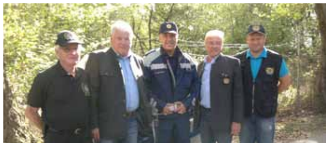
Predstavniki IPA Steiermark

Več o našem delu in aktivnostih si lahko preberete na spletnih straneh IPA RK Štajerske mb.ipaslovenija.org/index.php