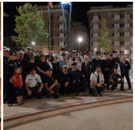
Skupinska fotografija ob zaključku patroljiranja