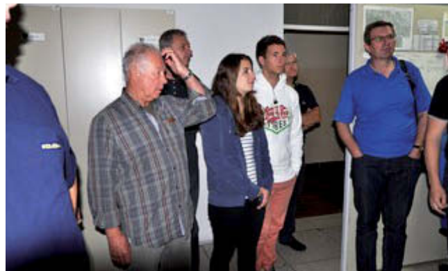
V Operativno-komunikacijskem centru PU Maribor

pri obdelavi interventnih dogodkov. Nakar smo se poslovili od naših prijateljev, ki so z dobrimi vtisi in občutki zapuščali Slovenijo. Tako kot ob sprejemu smo se tudi ob odhodu od prijateljev poslovili izpred policijske uprave Maribor z dogovorom, da se v naslednjem letu 2013 srečamo v Marburgu na Lahni.