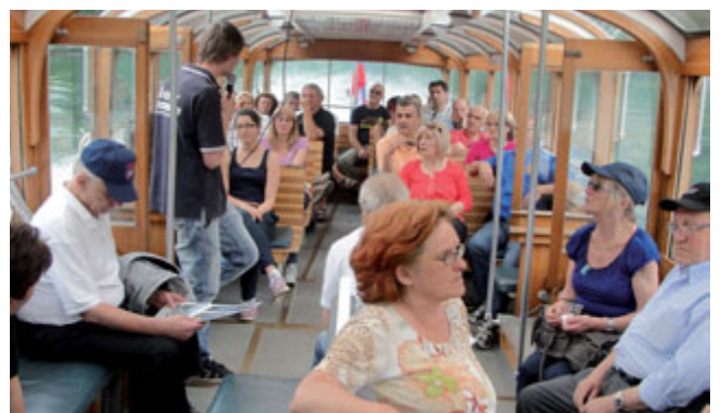
Vožnja z ladjico po Bohinjskem jezeru

Svečana akademija se je nato zaključila s pozdravi in zahvalami gostov ter naših prijateljev iz tujine in predstavnikov slovenskih regionalnih klubov s Štajerske, Ljubljane, Postojne, Kopra in Celja.