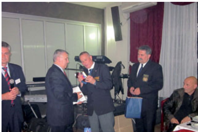
Izročitev spominskega darila

V pogovorih so bile zaznane številne težave, ki pestijo IPA sekcijo Srbijo. Težave imajo predvsem na profesionalnem področju z vidika organiziranosti, delovanja, članstva ipd... Pokazali so velik interes po medsebojnem sodelovanju, posebej pa željo po predstavitvi delovanja IPA sekcije Slovenije. Želeli bi izdelati tudi pravne akte, saj razen statuta drugih nimajo. Večkrat so poudarili, da imajo našo sekcijo za vzor delovanja. Tako je nastala ideja o medsebojnem, predvsem strokovnem srečanju predstavnikov IPA sekcije