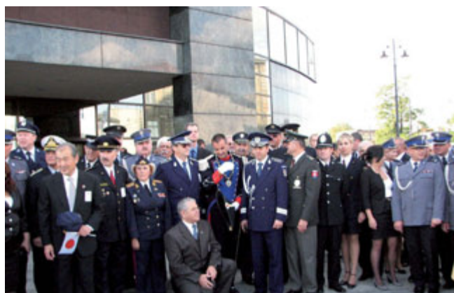
Skupinski posnetek pred pričetkom svečane akademije

Po kosilu smo si ogledali mesto Torun, ki je eno od najlepših mest na Poljskem.