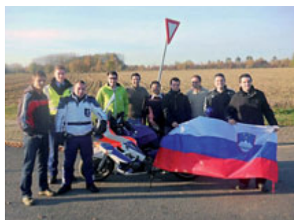
Z nizozemskimi policisti ...

K sebi smo prišli komaj po dobre pol ure. Moramo pa dodati, da so nas v finalnem