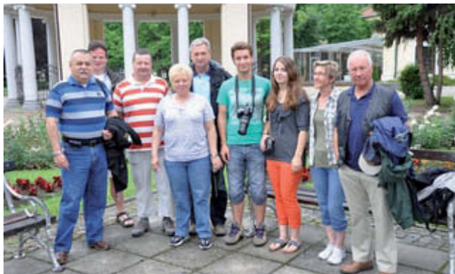
V Rogaški Slatini

Četrty dan so se prijatelji mudili še na OKC PU Maribor, kjer smo jih seznanili z delom in tehniko, ki jo delavci centra uporabljajo