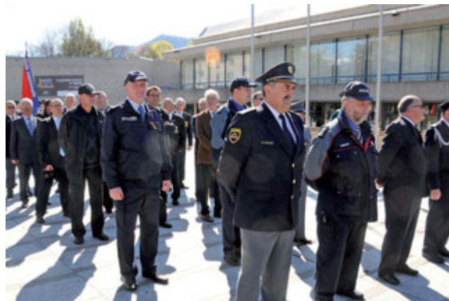
V družbi s predsednikom in generalnim sekretarjem IPA Švice

Vsak kanton ima v Švici namreč svojo policijo in »zvezne policije« nima. Celo specialne enote so menda organizirane po kantonih, ki so odgovorni tudi za opremo, oborožitev, finance in drugo. To pa pomeni tudi razlike v uniformah v Švici.