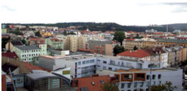
Ogledali smo si mesto Telč, ki je pod okriljem UNESCO

Polna vtisov in sklenjenih novih poznanstev sem v nedeljo, 19. 8. 2012, prispela v Benetke, kjer so me pričakali starši.