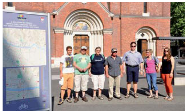
Pred Frančiškansko cerkvijo v Mariboru

V času praznovanja dneva policije nas je obiskala skupina 8 članov prijateljske organizacije IPA iz Marburga na Lahni. Kot vse goste, ki prihajajo k nam, smo jih na večer, 7. 6. 2012, sprejeli na MP Šentilj. Po pozdravu in okrepčilu smo jih nastanili v motelu Meranu in priredili večerjo v Ski centru Pohorje. Ob prijetnem klepetu starih znancev se je večerja zavlekla pozno v noč.