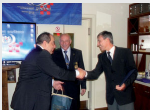
Fototrinki s sestanka v Ogulinu