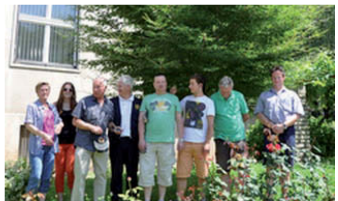
Pred drevosom prijateljstva IPA Maribor – IPA Marburg

Naslednji dan smo se posvečali ogledu kulturnih znamenitosti mesta Maribor, v okviru tega smo jih seznanili tudi z najstarejšo trto in dobrotami, ki jih ponuja ustanova Stare trte. Po kosilu, ki smo ga zaužili v prijetnih prostorih Sive goske v Trnovski vasi, smo se odpravili na raziskovanje po starem Ptujju in si ogledali muzejske zbirke na Ptujskem gradu. Prijetno vzdušje prijateljev smo zaključili z večerjo pri gostitelju Gastro na Ptujju. Po doživetem dnevu s prijatelji smo jih zapustili z lepimi vtisi dneva v hotelu Merano.