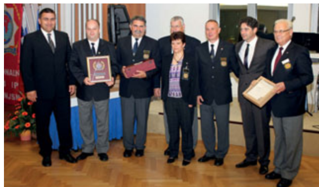
Del dobitnikov posebnih priznanj

Vrhunec vseh aktivnosti pa je bila večerna svečana akademija, ki je potekala v ovalni dvorani Hotela Larix.