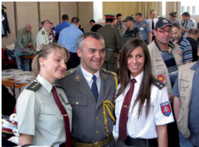
Predsednik IPA Dolenjske v prijetni družbi

Besedilo: Peter ŽUPANC