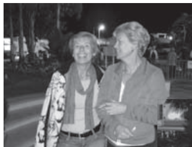
Cannes ponoči zaživi