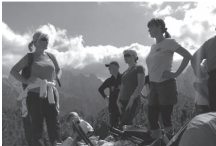
Končno pri vrhu