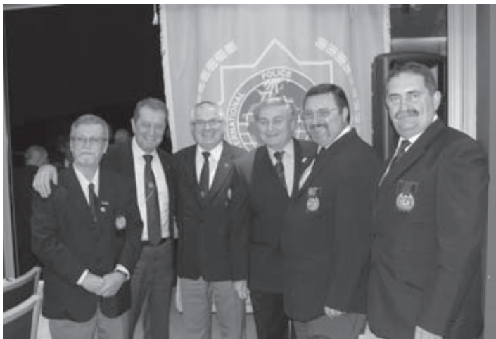
Prijatelji iz Slovenije, Hrvaške in Italije