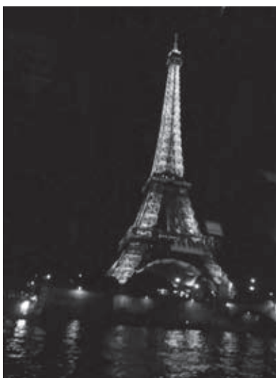
Eifflov stolp z ladjice na Seni

Nekaj posebnega so bili dogodki po koncu konference. Eno od večerij smo imeli na dveh ladjah, ki sta med večerjo pluli po Seni. Čeprav je bila noč, je breg pariške reke Sene zelo dobro osvetljen, tako da smo lahko opazovali Pariz tudi z ladje.