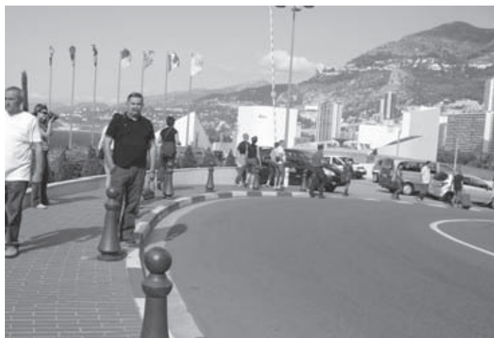
Znameniti ovinek dirke Grand prix

Po končanem ogledu kneževine Monaco smo se polni vtisov odpravili proti domu, kamor smo prišli v zgodnjih jutranjih urah.