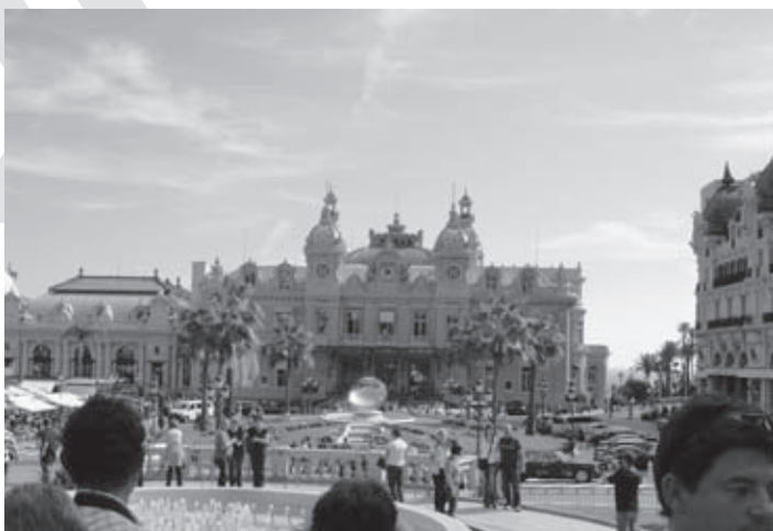
Igralnica – Casino Monte Carlo