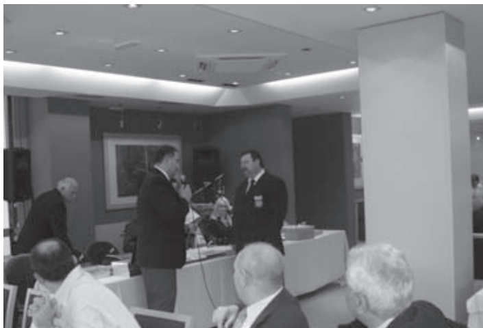
Pozdravni nagovor ter izmenjava daril

sekcija Slovenija. Po zaključeni slavnostni akademiji se je nadaljevalo prijateljsko druženje s programom.