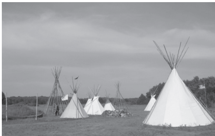
Pogled na indijansko vas

Ob sprejemu smo si ogledali prostore njihovega lično urejenega kluba in se po deveturni vožnji osvežili s hladno pijačo. Bogdan nas je pospremil v približno 40 km oddaljen kraj Pokoj, kjer smo bili v času srečanja nastanjeni na ranču »Buffalo ranch«, ob katerem je tudi indijansko naselje »Indian village«. Nastanili smo se v zanimivih sobah, urejenih v stilu divjega zahoda. Po krajšem počitku smo se zbrali in spoznali z ostalimi člani kluba, ogledali pa smo si tudi bližnje indijansko naselje ter dobili nekaj vtisov o življenju indijancev. V večernih urah so se nam pridružili še po trije člani iz Slovaške, Madžarske in Romunije, tako da se je prvi dan, ob prijetnem druženju, predstavitvi dela, izmenjavi mnenj in izkušenj ter degustaciji nacionalnih pijač, končal šele v poznih večernih urah.