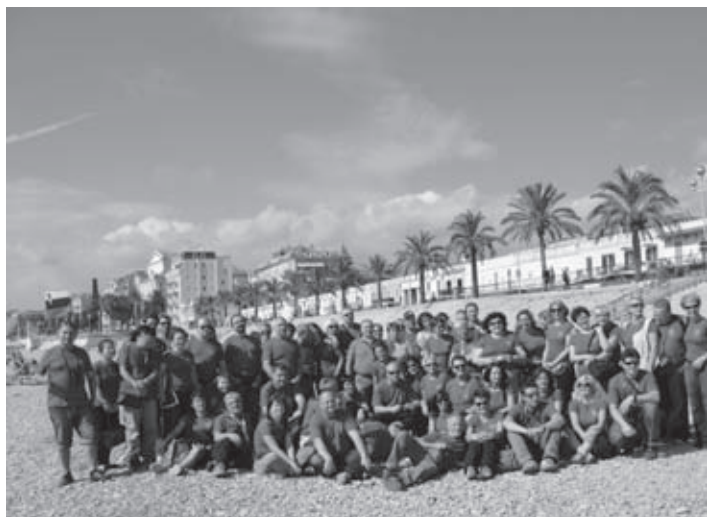
Skupinski posnetek na plaži

V poznih večernih urah smo, 30. 9. 2010, krenili proti cilju in po nočni vožnji skozi Slovenijo in Italijo v dopoldanskem času prispeli v Francijo – cote d' Azour.