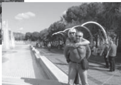
Le ena izmed fontan

Noč smo dočakali v mestu Cannes – mestu romantike in filmske industrije. Po večernem ogledu znamenite promenade de la Croisette, ki poteka tik ob sredozemskem morju, ob kateri stojijo najimennejši hoteli, smo si privoščili nočni počitek v hotelu Etap v samem središču mesta.