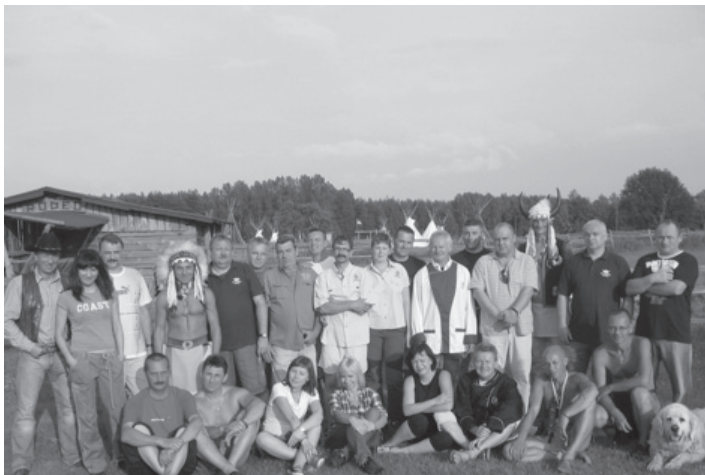
Del udeležencev srečanja

Prijetno srečanje in razpoloženje v vseh dneh bivanja na Poljskem so skušali motiti le komarji - zaradi območja z jezeri in predhodnih poplav jih je bilo namreč ogromno. No ja, pa saj smo bivali na ranču, kajne?!