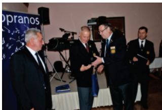
Predsednik in generalni sekretar IPA sekcije Slovenije sta tujim delegacijam izročila spominska darila