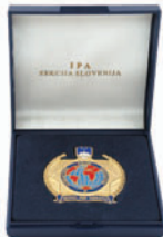
Plaketa I.P.A. mala Ø50mm, v PVC škatlici, dimenzije 90x90mm, modre barve