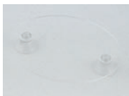
Nosilec nalepke I.P.A.

za vetrobransko steklo, plexy, za nalepko I.P.A.