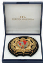
Našitek I.P.A. vezen s kovinsko nitko, v pvc embalaži dimenzije 90x90 mm, modre barve