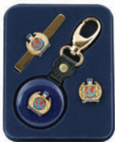
Komplet I.P.A. obesek, kratavna sponka in značka, v PVC embalaži