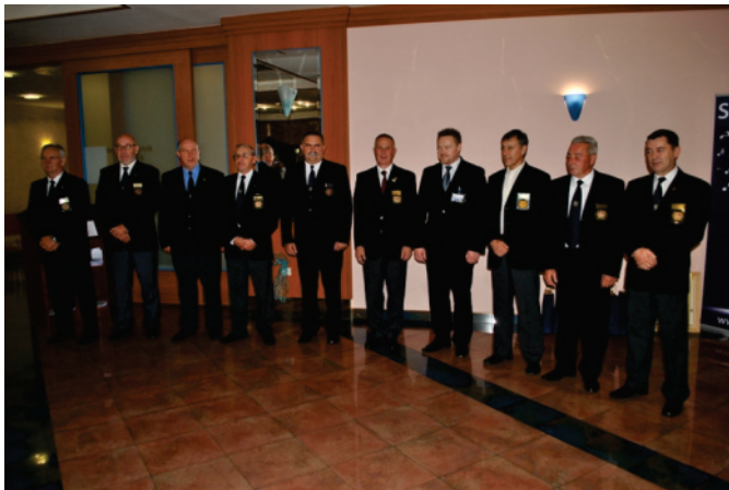
Novo vodstvo IPA sekcije Slovenije