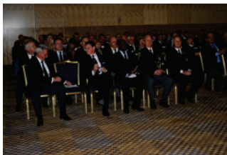
Gosti na svečani otvoritvi