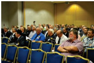
Delegatke in delegati na kongresu