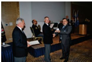
Predsednik IPA sekcije Slovenije in generalni sekretar pri podeljevanju priznanj

upravnega odbora za obdobje 2011 - 2014, poročilo nadzornega odbora in poročilo častnega razsodišča. V nadaljevanju so bile sprejete tudi programske usmeritve za delo IPA sekcije Slovenije, za obdobje 2014 - 2017. Ker je bil kongres tudi volilni, je bilo po izvedenem kandidacijskem postopku v